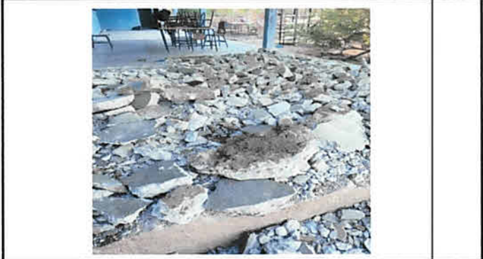
Foto 2: Sustrucción y fundición de torta de concreto para colocar piso cerámico antideslizante