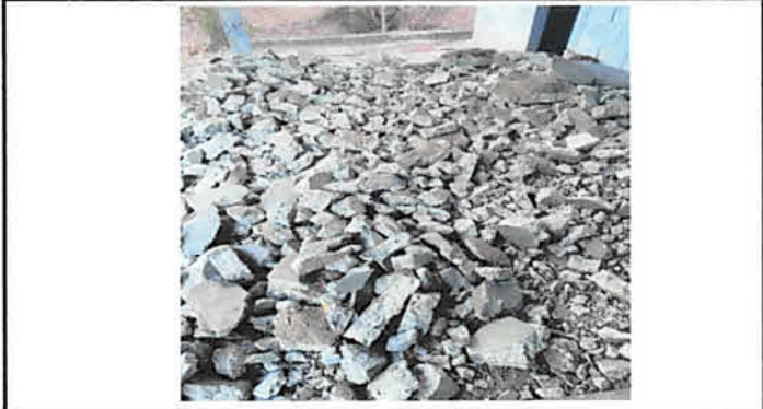
Foto 1: Sustrucción y fundición de torta de concreto para colocar piso cerámico antideslizante