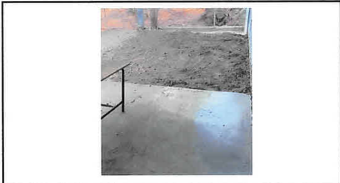
Foto 3: Sustrucción y fundición de torta de concreto para colocar piso cerámico antideslizante